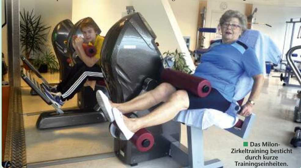
■ Das Milon-Zirkeltraining besteht durch kurze Trainingseinheiten.

Physiotherapiepraxis Brehmer & Hadamietz GmbH Börnicker Chaussee 1 16321 Bernau Tel. 033 38/60 41 60 Fax 033 38/60 41 62 www.physiotherapiebernaude.de Zirkeltraining Mo.-Fr. 8-20 Uhr