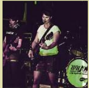
■ Bernau hat mit der Gruppe „What“ eine Band, die fast nur aus Mädchen besteht.

Ob es 2017 genauso weiter geht, steht übrigens in den