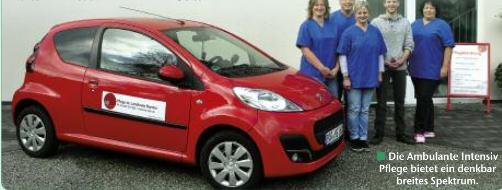
■ Die Ambulante Intensiv Pflege bietet ein denkbar breites Spektrum.

Ambulante Intensiv Pflege UG Prenzlauer Chaussee 176 a 16348 Wandlitz Tel. 03 33 97/27 30 25 24-h-Tel. 01 51/40 16 11 63 Fax 03 33 97/27 30 26 www.aip-web.de