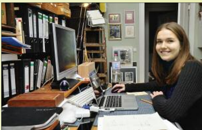
■ Die Künstlerin gibt ihr Wissen gern an Jugendliche weiter.