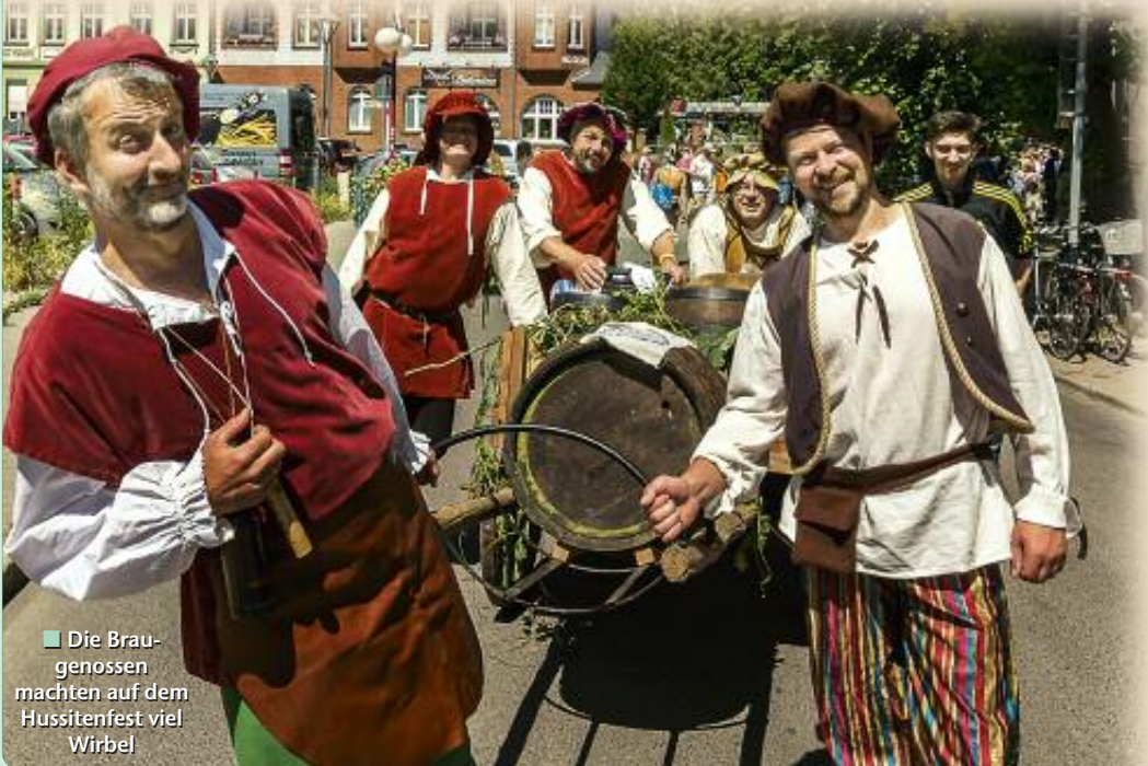
■ Die Braugenossen machten auf dem Hussitenfest viel Wirbel