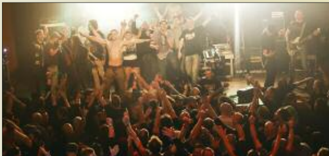
■ Wenn Weihnachten ruft, tobt der Saal.

Die weihnachtlichen Punk-Treffen wurden schnell zum Geheimtipp der Szene. „Das ‚Dosto‘ war bald zu klein. Wir wechselten in das ‚Alte Postamt‘. Doch dies reichte mittlerweile ebenfalls nicht mehr aus. Fans warteten vergeblich darauf eingelassen zu werden, weil wir keinen Platz hatten.“ Deshalb „siedelte“ das stets ausverkaufte Festival zum zehnten Jubiläum 2015 in die „Stadthalle Bernau“ um. „Das hatte den Vorteil, dass wir uns dort nicht mehr um die Bar ▶